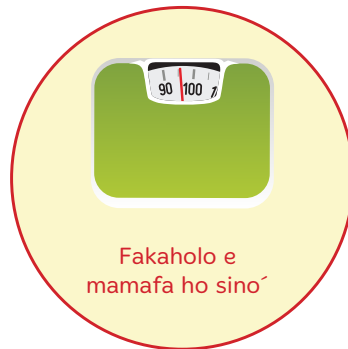
Fakaholo e mamafa ho sino'