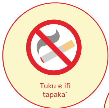
Tuku e ifi tapaka'

Ko e hā te u fai ke fakasi'isi'i ai e fakatu'utāmaki 'o e tu'u fakafokifā e tā hoku mafu' pe ko 'eku pā kālava? Ko e hā e fale'i 'a e toketaa'?