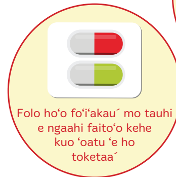
Folo ho'o fo'i'akau' mo tauhi e ngaahi faito'o kehe kuo 'oatu 'e ho toketaa'

Tokanga'i e tu'unga 'oku 'i ai hoku toto ma'olunga', pehē ki he lahi e ngako mo e Suka 'i hoku toto'