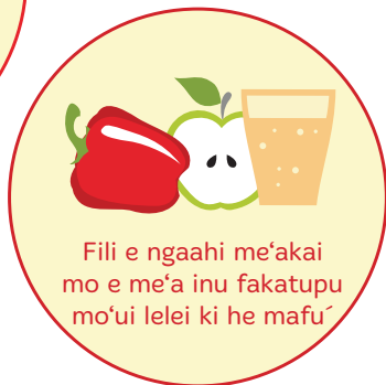
Fili e ngaahi me'akai mo e me'a inu fakatupu mo'ui lelei ki he mafu'