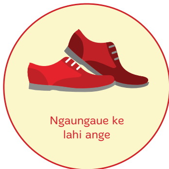
Ngaungaue ke lahi ange