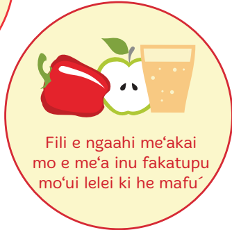
Fili e ngaahi me'akai mo e me'a inu fakatupu mo'ui lelei ki he mafu'