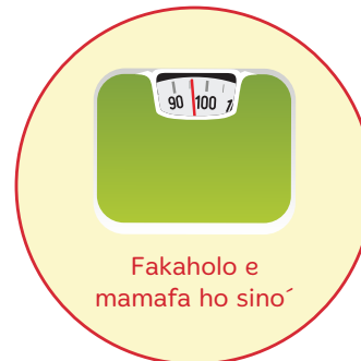
Fakaholo e mamafa ho sino'