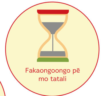
Fakaongoongo pē mo tatali