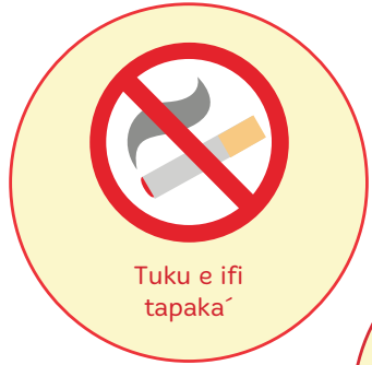
Tuku e ifi tapaka'

Ko e hā te u fai ke fakasi'isi'i ai e fakatu'utāmaki 'o e tu'u fakafokifā e tā hoku mafu' pe ko 'eku pā kālava? Ko e hā e fale'i 'a e toketaa'?