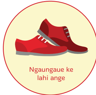
Ngaungaue ke lahi ange