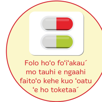
Folo ho'o fo'i'akau' mo tauhi e ngaahi faito'o kehe kuo 'oatu 'e ho toketaa'